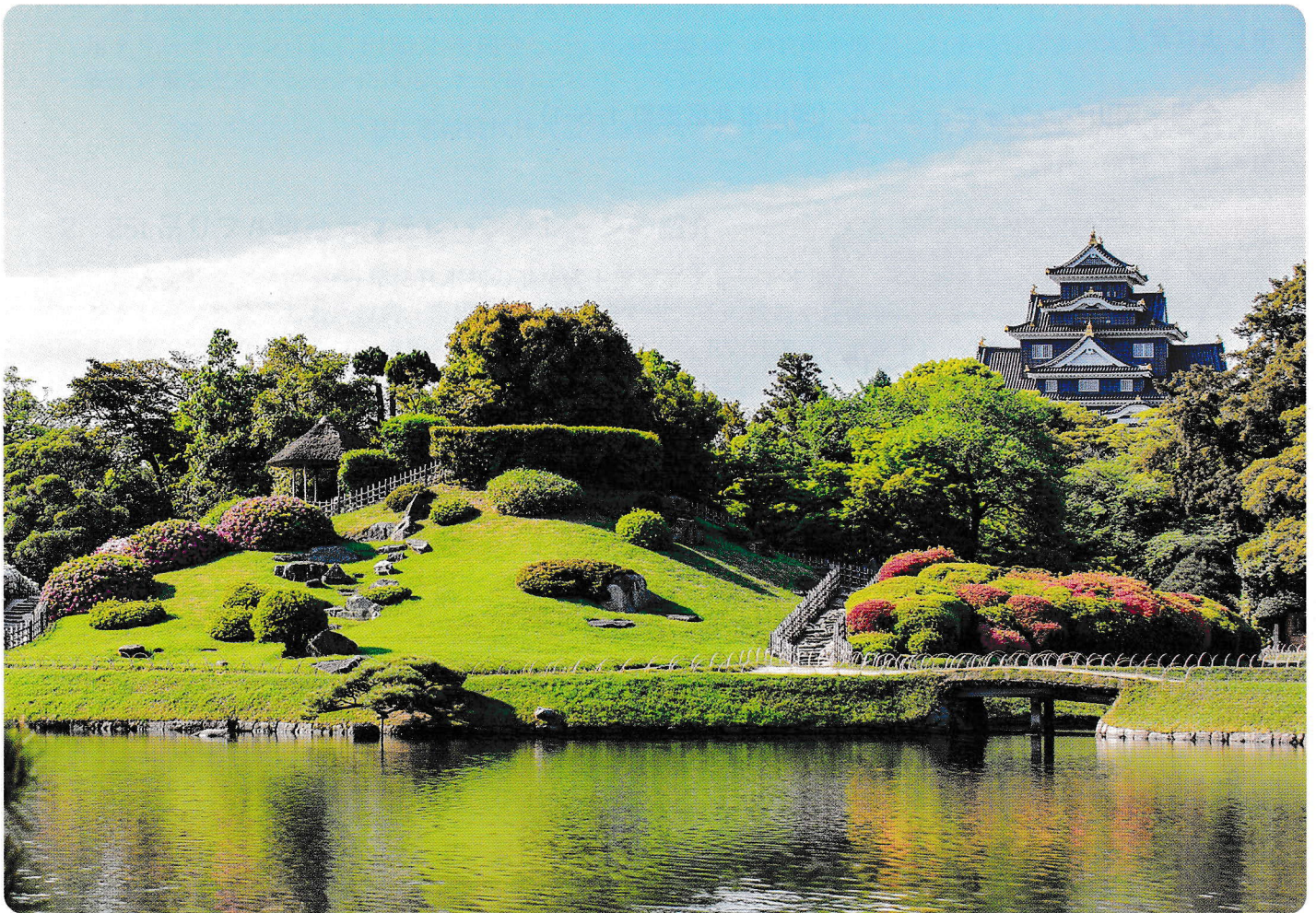
日本三名園「後楽園」より望む漆黒の岡山城